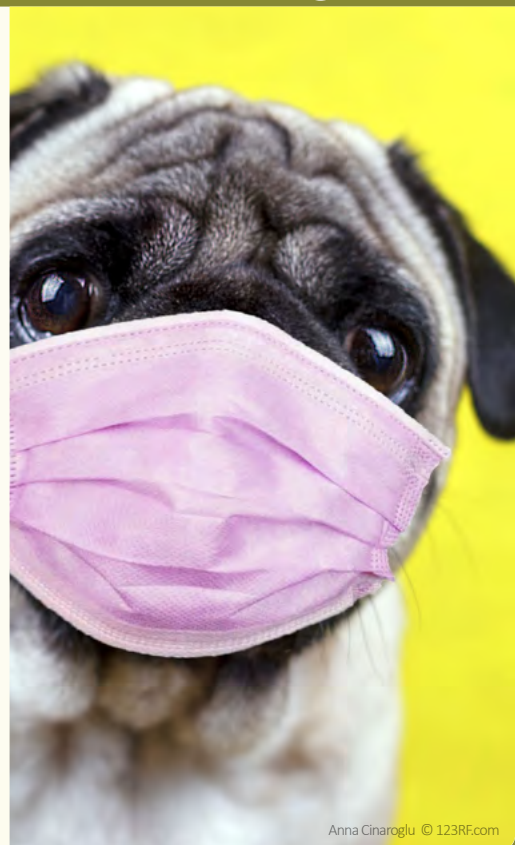
Anna Cinaroglu © 123RF.com

Heureusement, elle n'est pas contagieuse pour l'homme! Si vous avez des questions concernant cette maladie ou la vaccination, n'hésitez pas à nous solliciter.