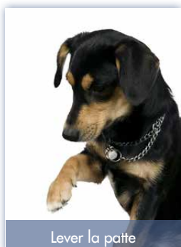
Lever la patte