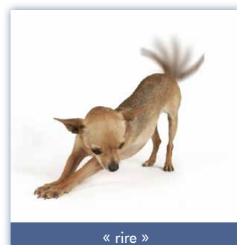
« rire »