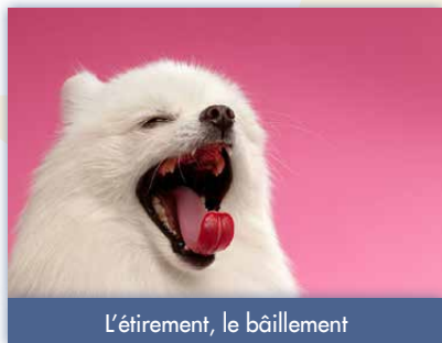
L'étirement, le bâillement