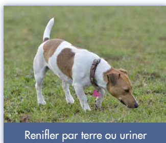
Renifler par terre ou uriner