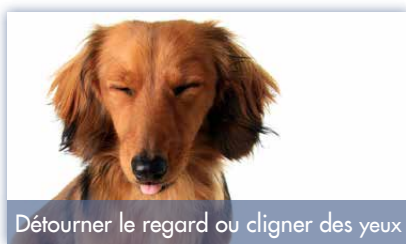
Détourner le regard ou cligner des yeux