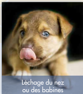
Léchage du nez ou des babines