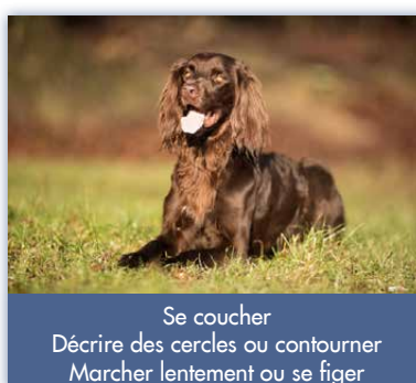
Se coucher Décrire des cercles ou contourner Marcher lentement ou se figer