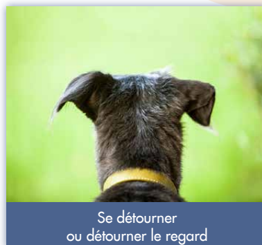
Se détourner ou détourner le regard